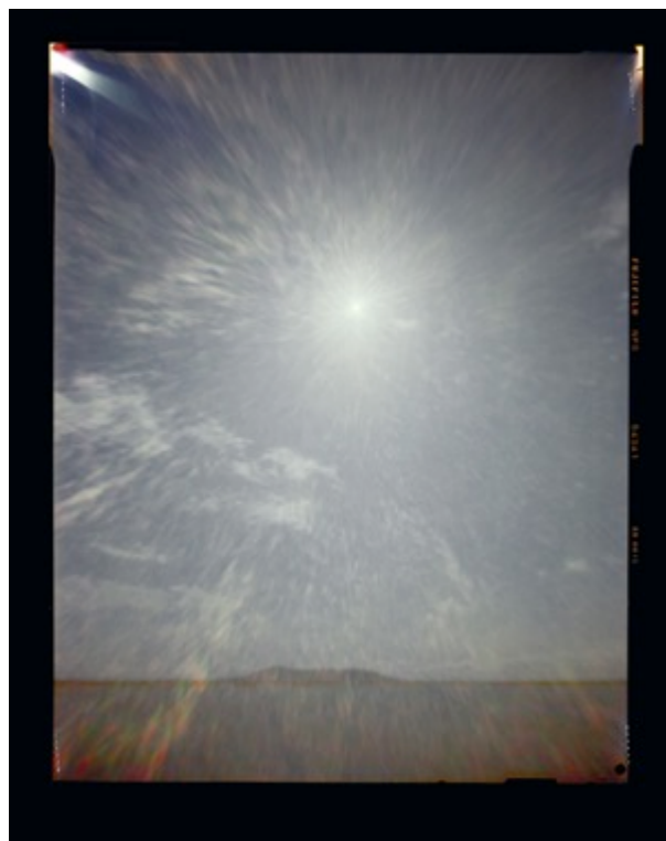
Héliographie #61 Dimensions 95 x 120 cm Tirage couleurs chromogène Jean Gabriel Lopez