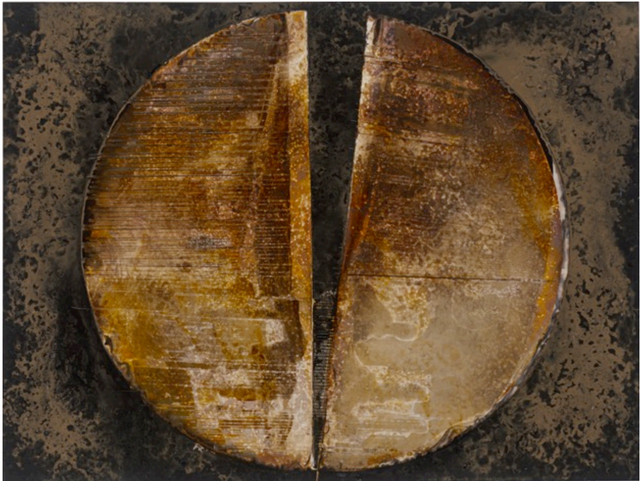
Cercle brisé , 2015