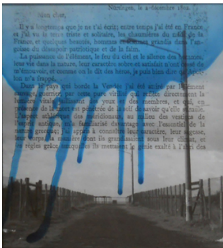
Topographie - 2010 dimensions : 52 x 52 cm tirage numérique, couleur à vitrail, report sur verre © S. Puglia

... Ou dites qu'il est Grec. Déjà les mots dont on se sert pour tenter de décrire son œuvre l'auront laissé entendre : « logies », « technies » ou « graphies » de toute nature. « Histoires » aussi, d'ailleurs. Ce n'est sans doute pas un hasard. L'abstrait (le logique ?) et le concret (le graphique ?), partis de deux points opposés d'on ne sait quel espace commun, sont venus se rejoindre, tantôt fondus tantôt heurtés, télescopés dans la profondeur maigre de ces plans à la géométrie reconnaissable entre toutes – on devrait les appeler des « surfaces de Puglia ». Comment nommer ce que produit leur collision : des photologies ? des technographies ?