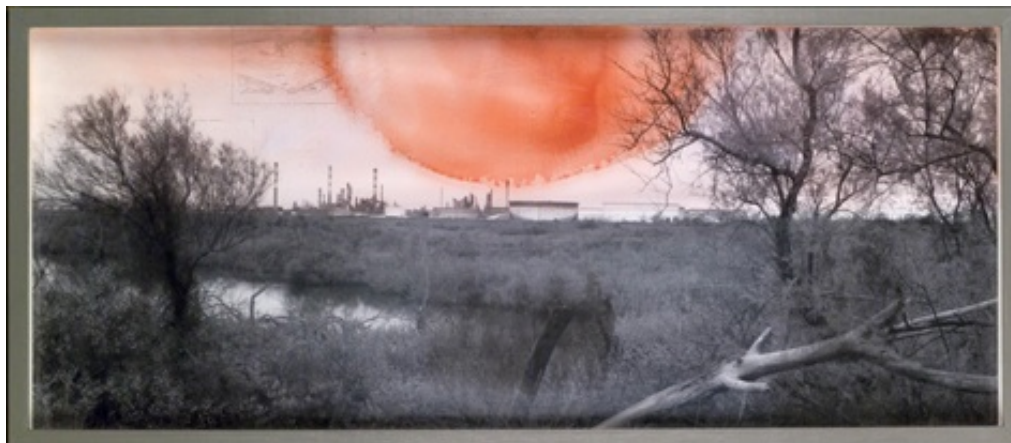
Gulliver à Lavéra - 2010-2011 dimensions : 102 x 44 cm tirage numérique, plexiglas, report sur verre