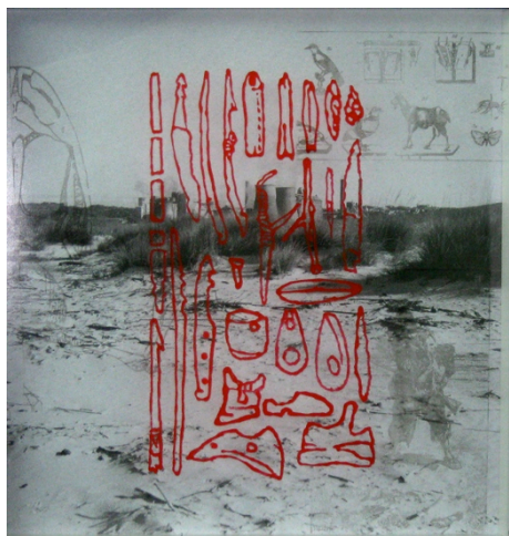
Robinson a Rosignano - 2011 dimensions : 52 x 52 cm tirage numérique, couleur à vitrail, report sur verre © S. Puglia