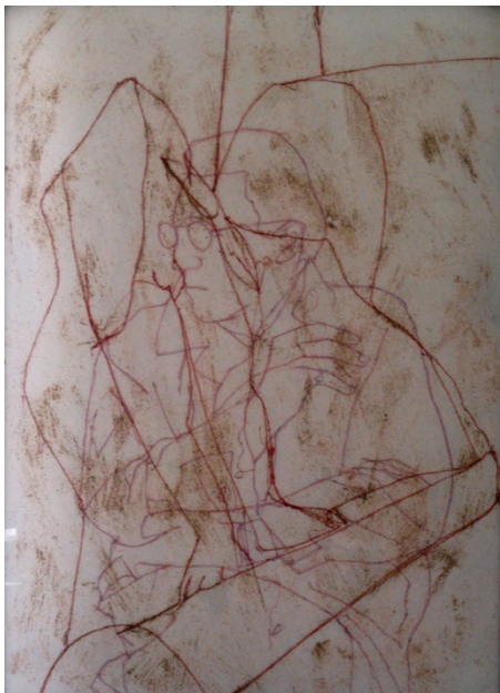
From Pompei - 2010-2011 dimensions : 51 x 71 cm verre, fer, acétate, fil à coudre, latex

4, rue sainte-anastase 75003 paris - france - tél. + 33 (0)1 42 78 08 07 - info@sitdown.fr - www.sitdown.fr