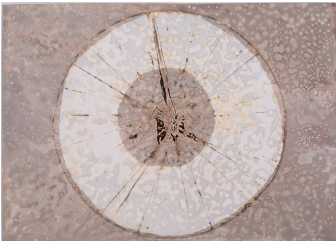
Sans titre n°3 , 2014 Dimensions : 12.6 x 17.7 cm chimigramme sur papier argentique au chlorobromure d'argent © Silvi SIMON courtesy galerie SIT DOWN