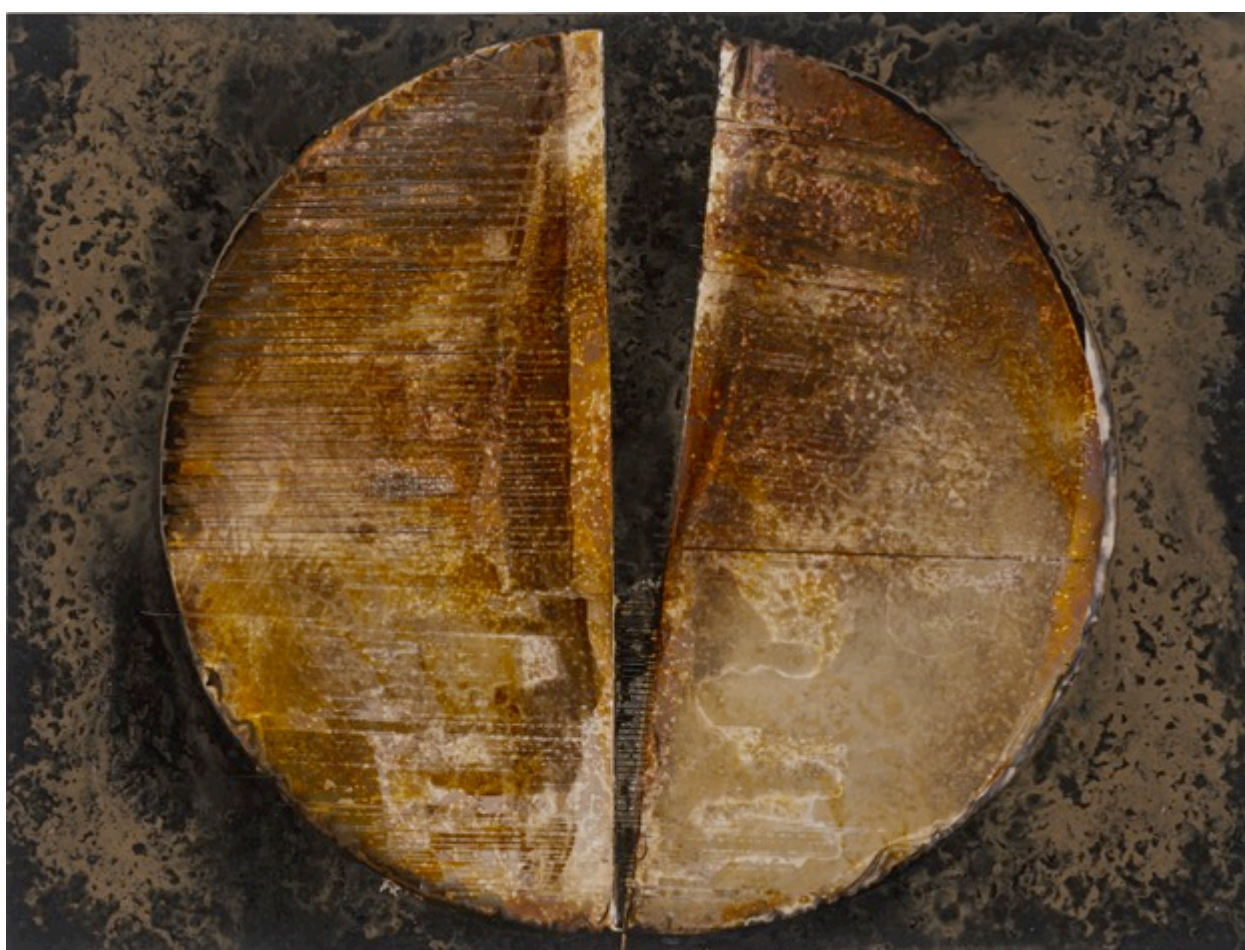
Cercle brisé 3, 2015