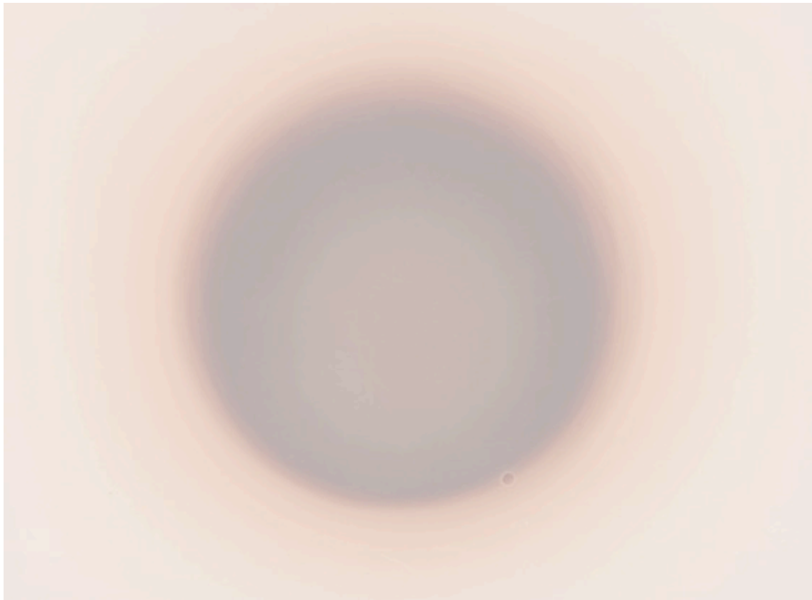
Lumière fixée 13, 2015 Dimensions : 17.7 x 23.9 cm Insolation sur papier argentique au chlorobromure d'argent