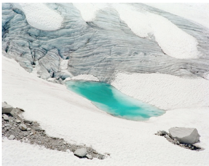
Glacier du Tour : Vue prise près du Refuge Albert 1 er Tirage sur papier de riz, dimensions : 60 x 75 cm © Aurore Bagarry courtesy galerie Sit Down