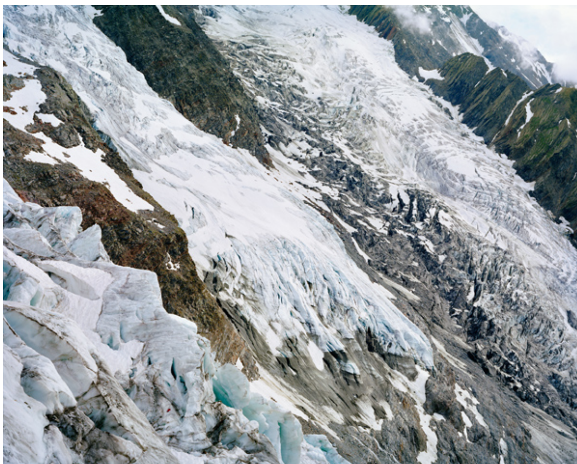
La Jonction, glaciers des Bossons et du Taconnaz Tirage sur papier coton, dimensions : 100 x 125 cm

Avec le soutien du Centre National des Arts Plastiques (aide à la première exposition)