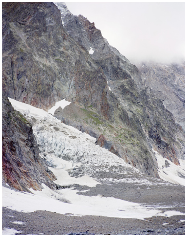
Glacier du Miage, vue prise du Glacier du Miage Tirage sur papier de riz, dimensions : 60 x 75 cm