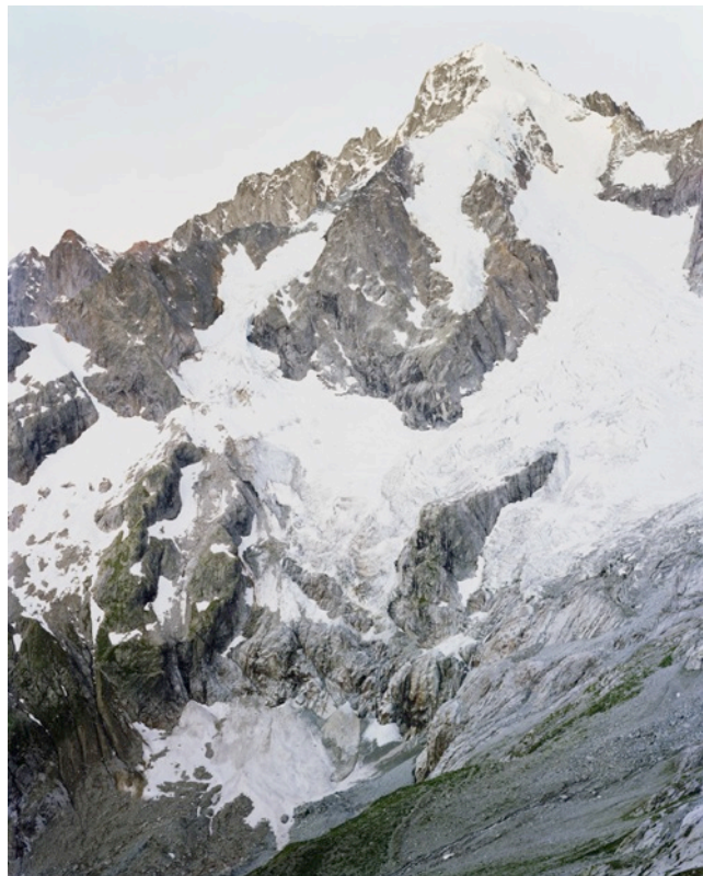
Glacier de l'A Neuve, vue prise de la cabane de l'A Neuve Tirage sur papier de riz, dimensions : 60 x 75 cm