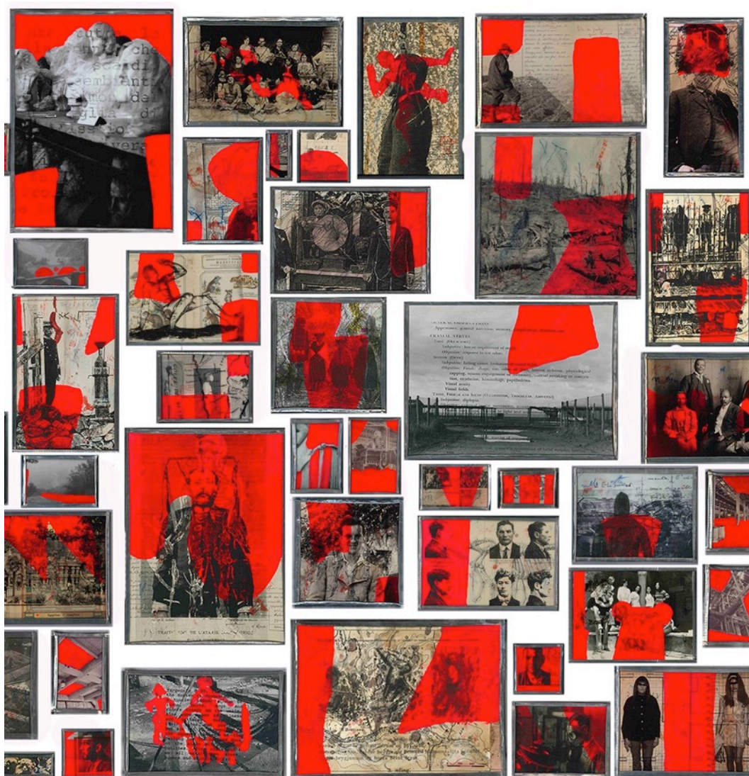
Série Millenovecento , 2018-2020 (détail de l'installation).