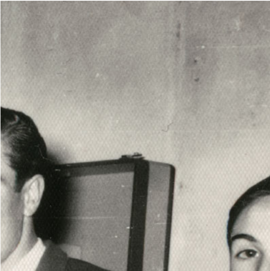
Série Le quatrième mur. Sans titre #8, 2015-2020 Dimensions : 60 x 60 cm Tirage pigmentaire