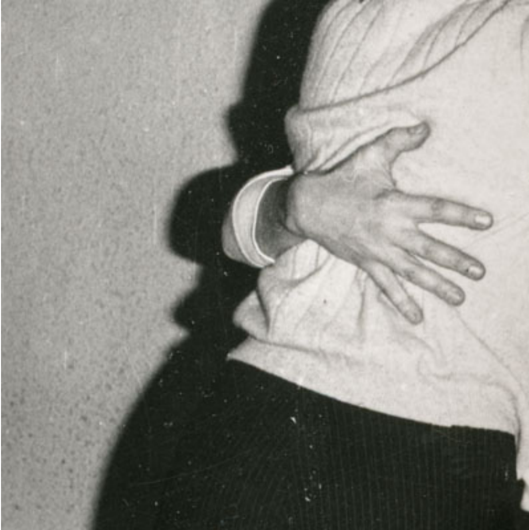
Série Le quatrième mur. Sans titre #14, 2015-2020 Dimensions : 60 x 60 cm Tirage pigmentaire