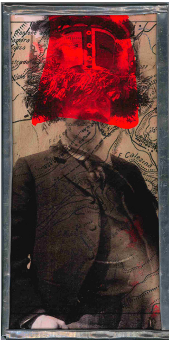
Série Millenovecento , Warburg kachina . 2019 Dimensions : 30 x 15 cm Technique mixte ©Salvatore Puglia courtesy galerie Sit Down