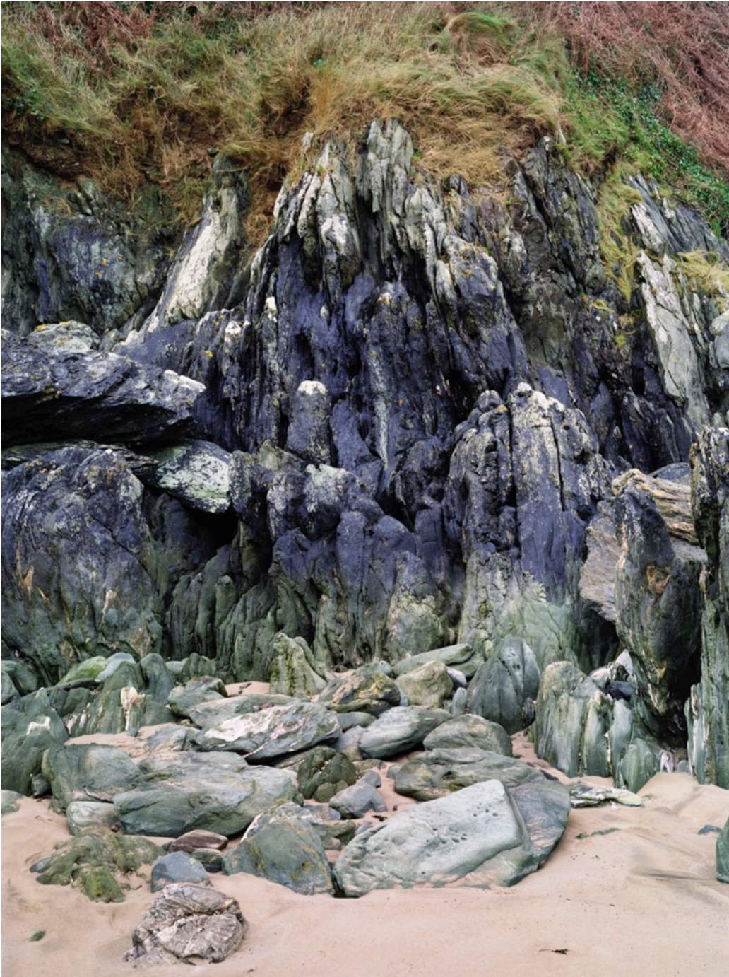
Série Roches | Plage des Curés, Plestin-les-Grèves, Côtes d'Armor, 2016-2020 Schistes verts de la formation de l'Armorique d'âge briovérien

Tirage pigmentaire sur papier Fine Art Rag contrecollé sur aluminium Format 70 x 85 cm | Edition de 7 exemplaires + 2 épreuves d'artiste