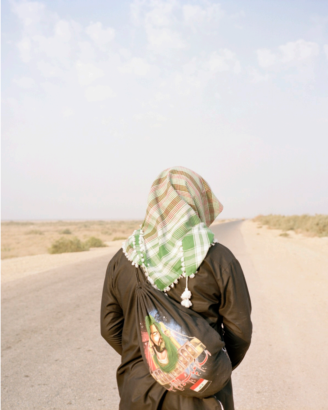
Série TransAnatolia , Pélerin sur la route vers la ville sainte de Kerbala, Irak , 2018 Tirage chromogène