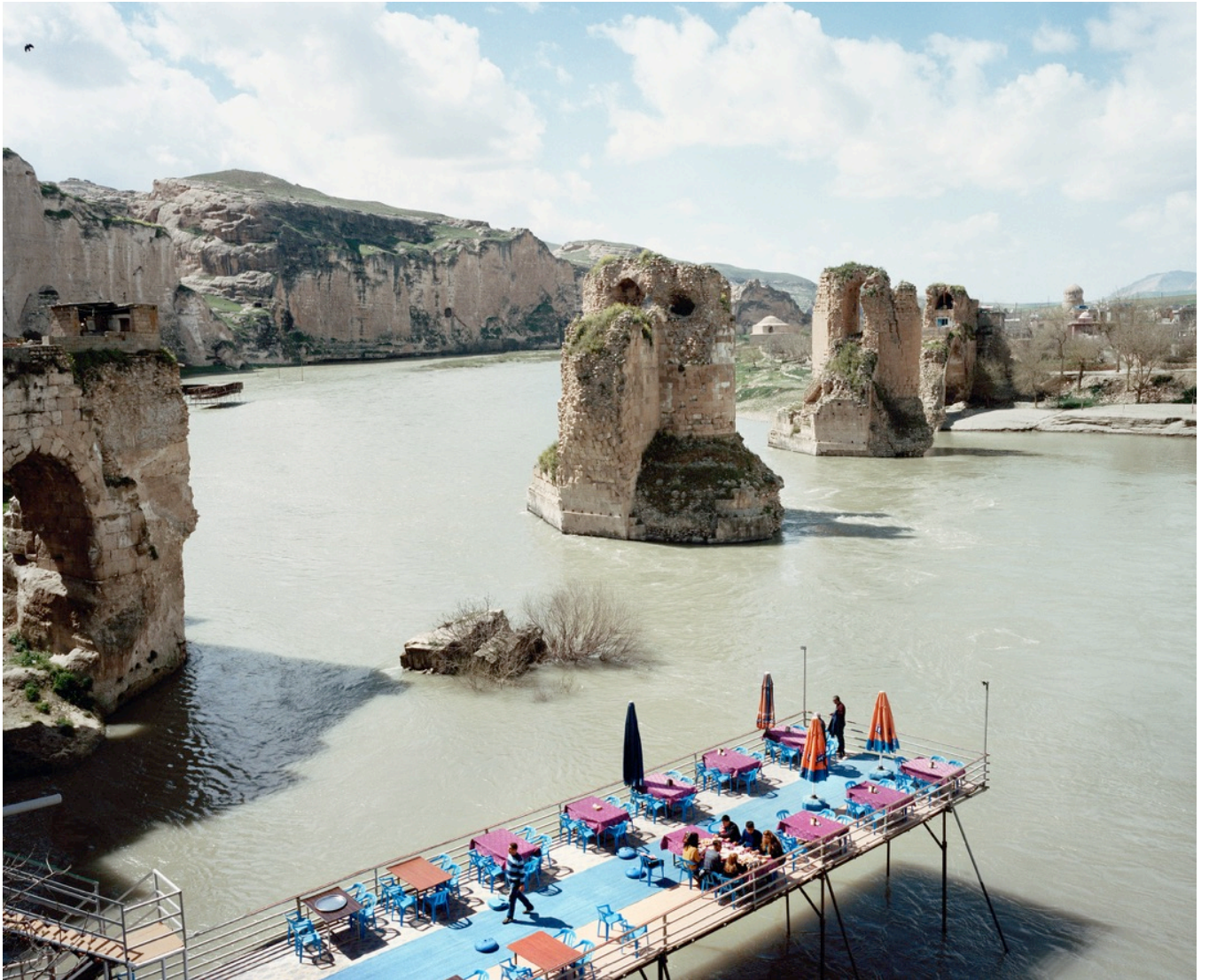
Série TransAnatolia , Vue sur le Tigre , Turquie, 2013 Tirage chromogène