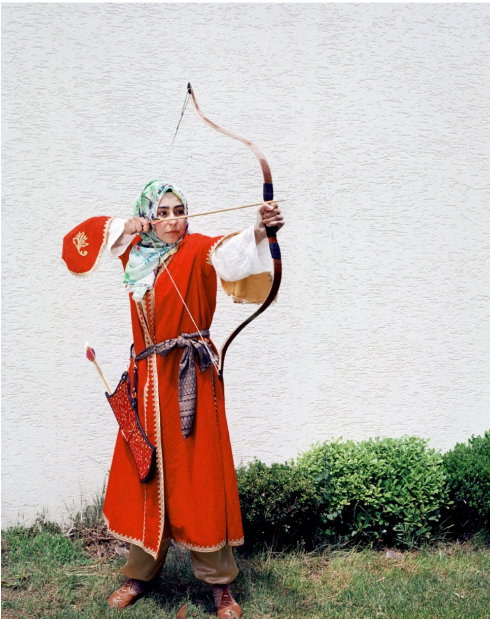
Série TransAnatolia , Une archère à l'International Conquest Cup, Istanbul, Turquie, 2015 Tirage chromogène

Exposition du 10 juin au 17 juillet 2021