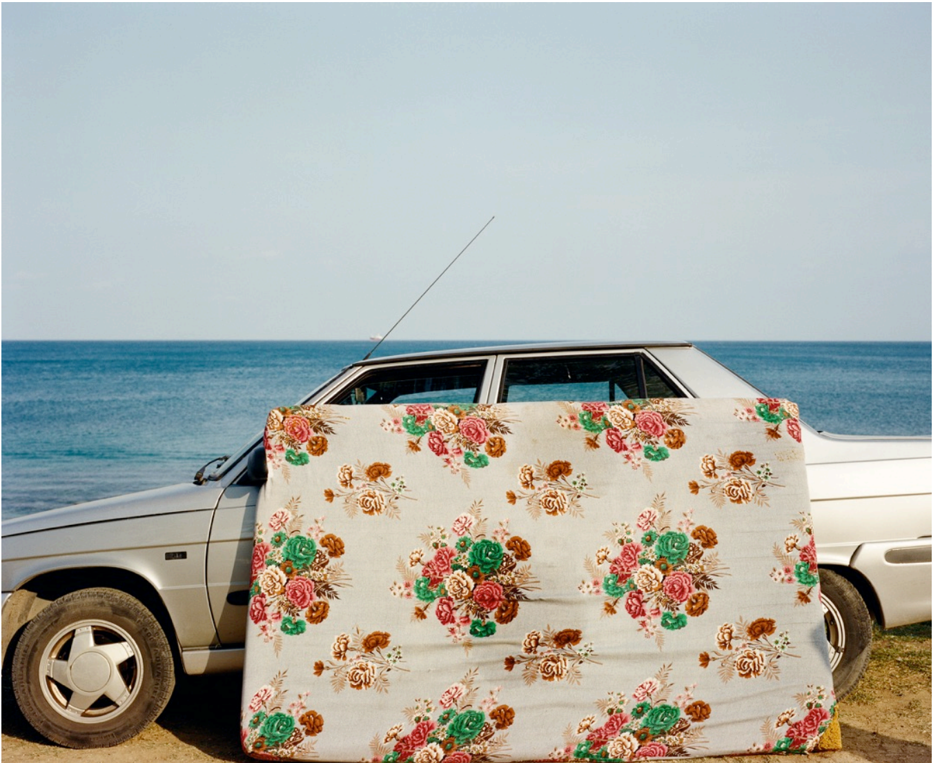
Série TransAnatolia , Plage de Sinop, rives de la mer Noire, Turquie , 2013 Tirage chromogène