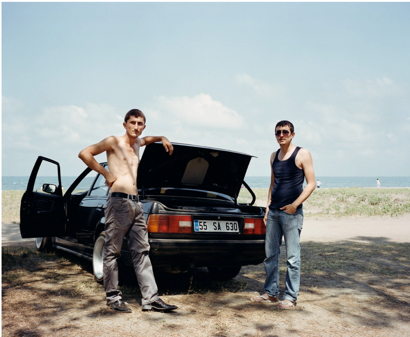
Série TransAnatolia , Plage de Samsun, rives de la mer Noire, Turquie, 2011