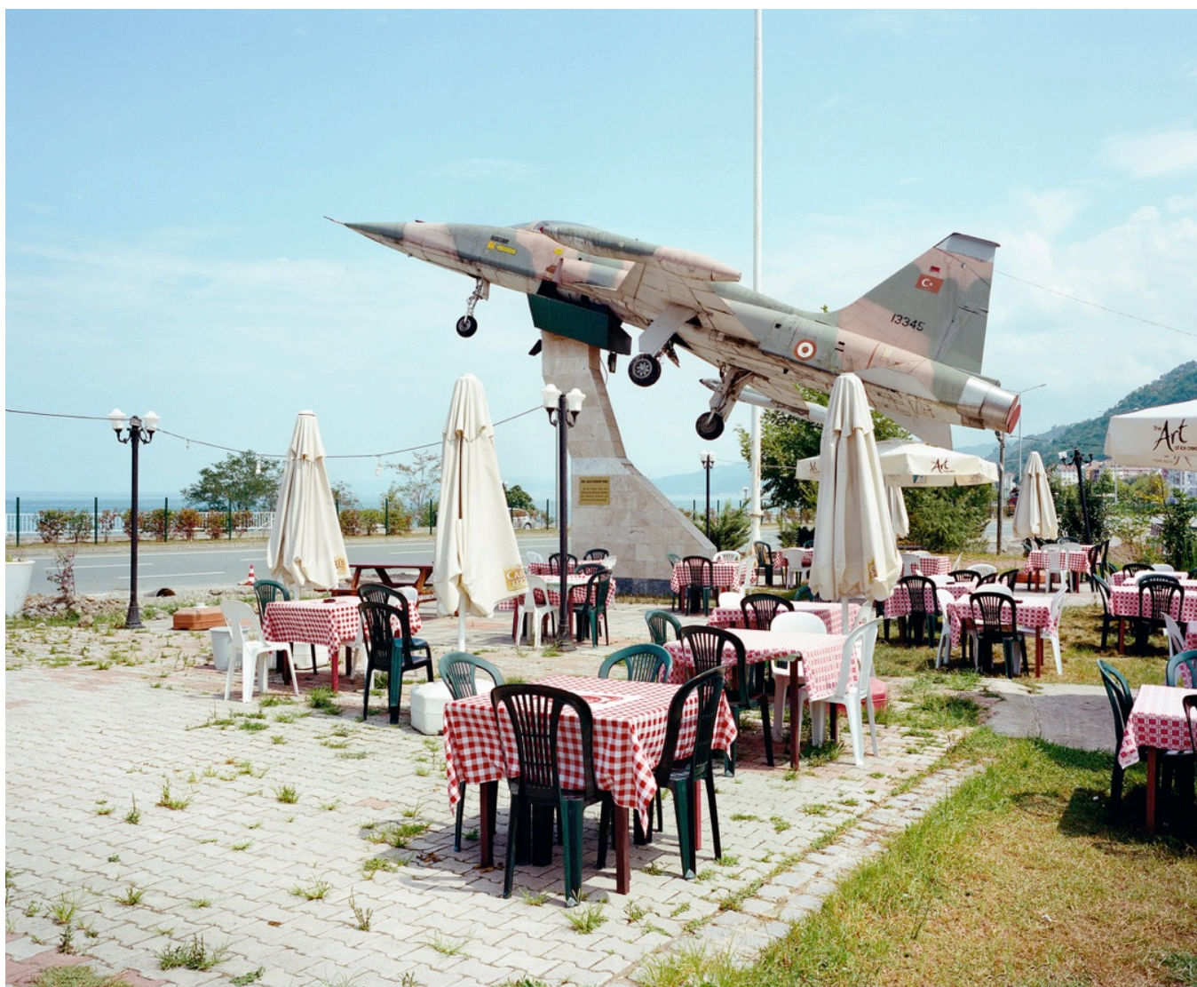
Série TransAnatolia , Près de Gerze, rives de la mer Noire, Turquie, 2013