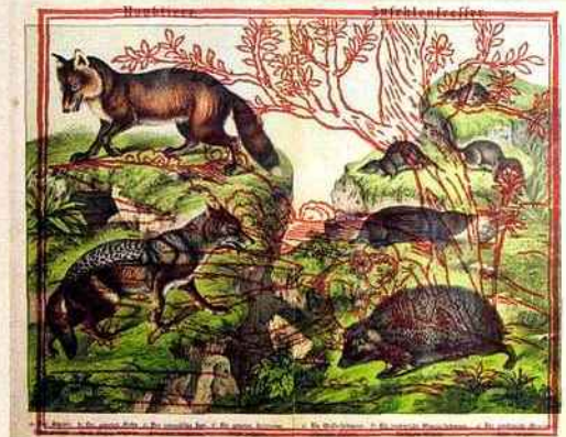
Salvatore Puglia, Raubtiere 03 , 2018, planche zoologique, impression numérique sur verre, 31 x 40 cm.

Du 1 er décembre au 5 janvier 2019, du mercredi au samedi de 11h à 13h et de 15h à 18h et sur rendez-vous