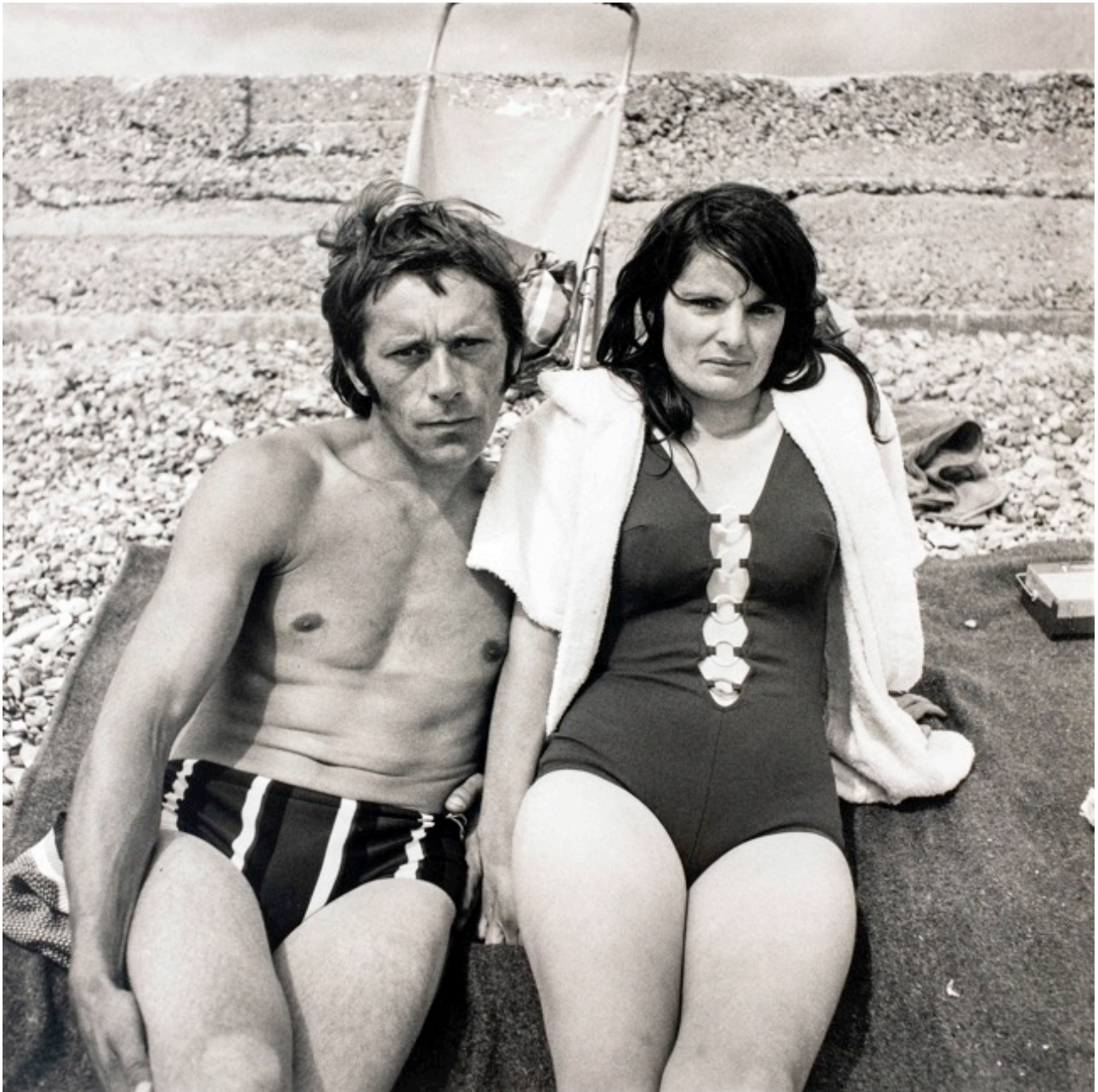
Tom Wood, On the beach, South coast of England, 1973 , Tirage gélatino-argentique viré au sélénium