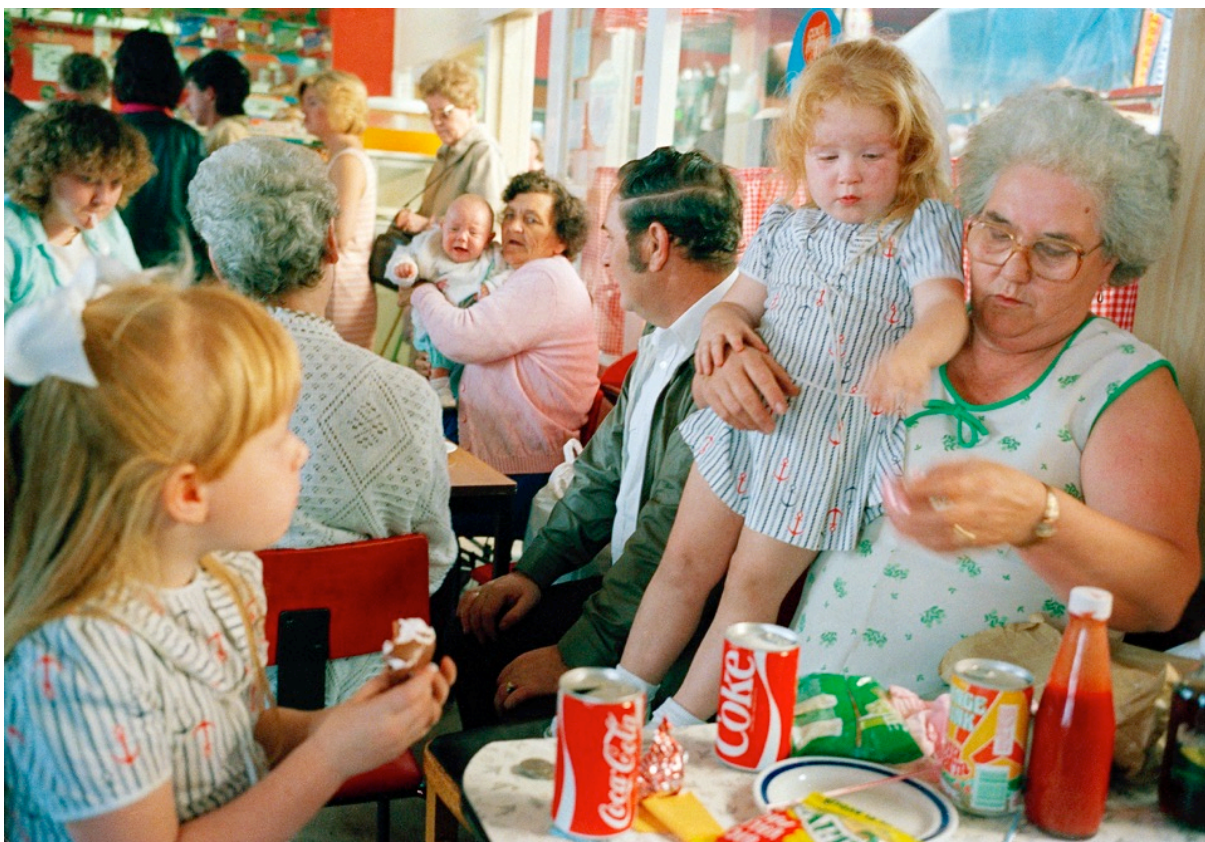
Tom Wood, Old time parting , 1983,