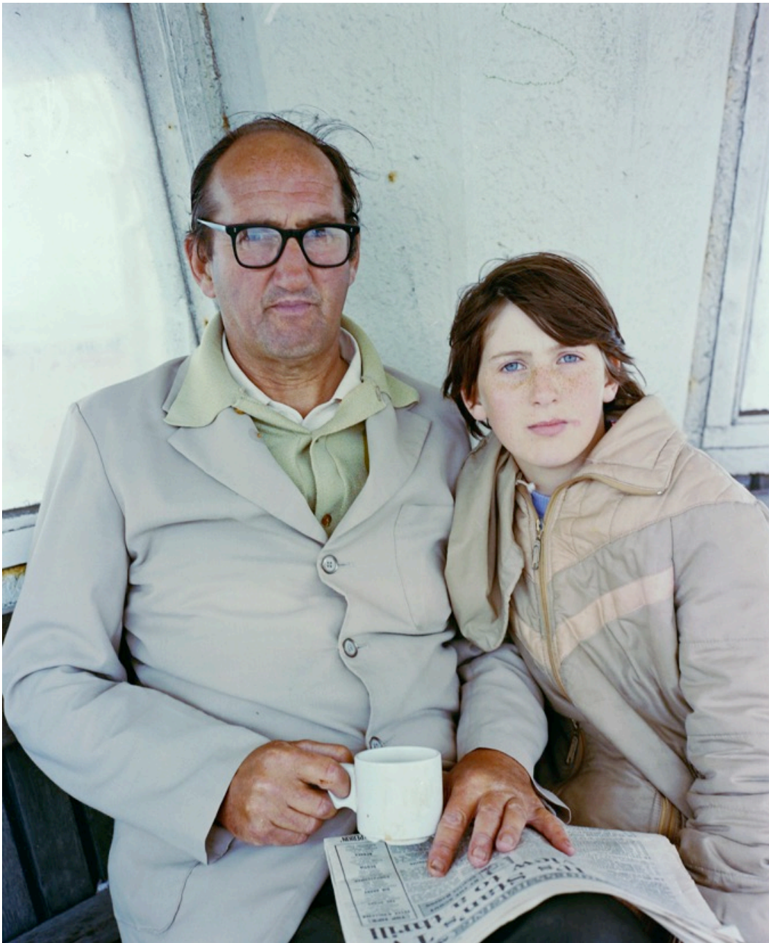
Tom Wood, Prom shelter picnic , 1983, Tirage analogique chromogène