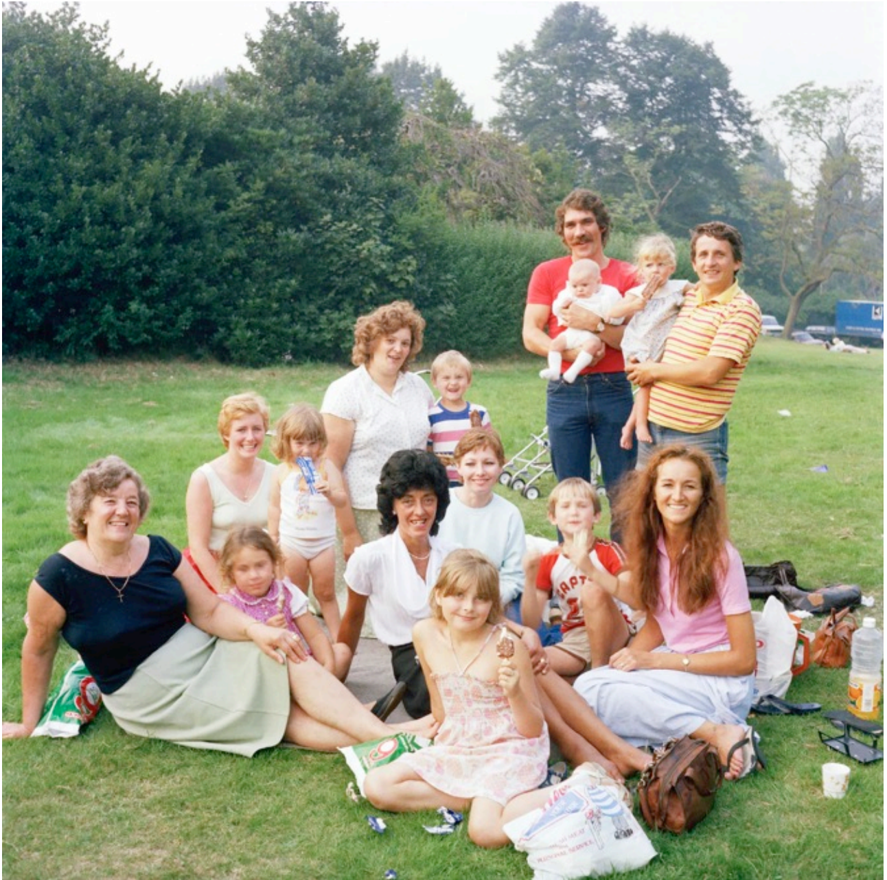
Tom Wood, Summer picnic, Sefton Park, 1980 , Tirage analogique chromogène