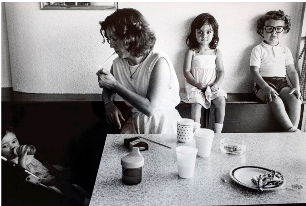
Tom Wood, Being good , 1982,