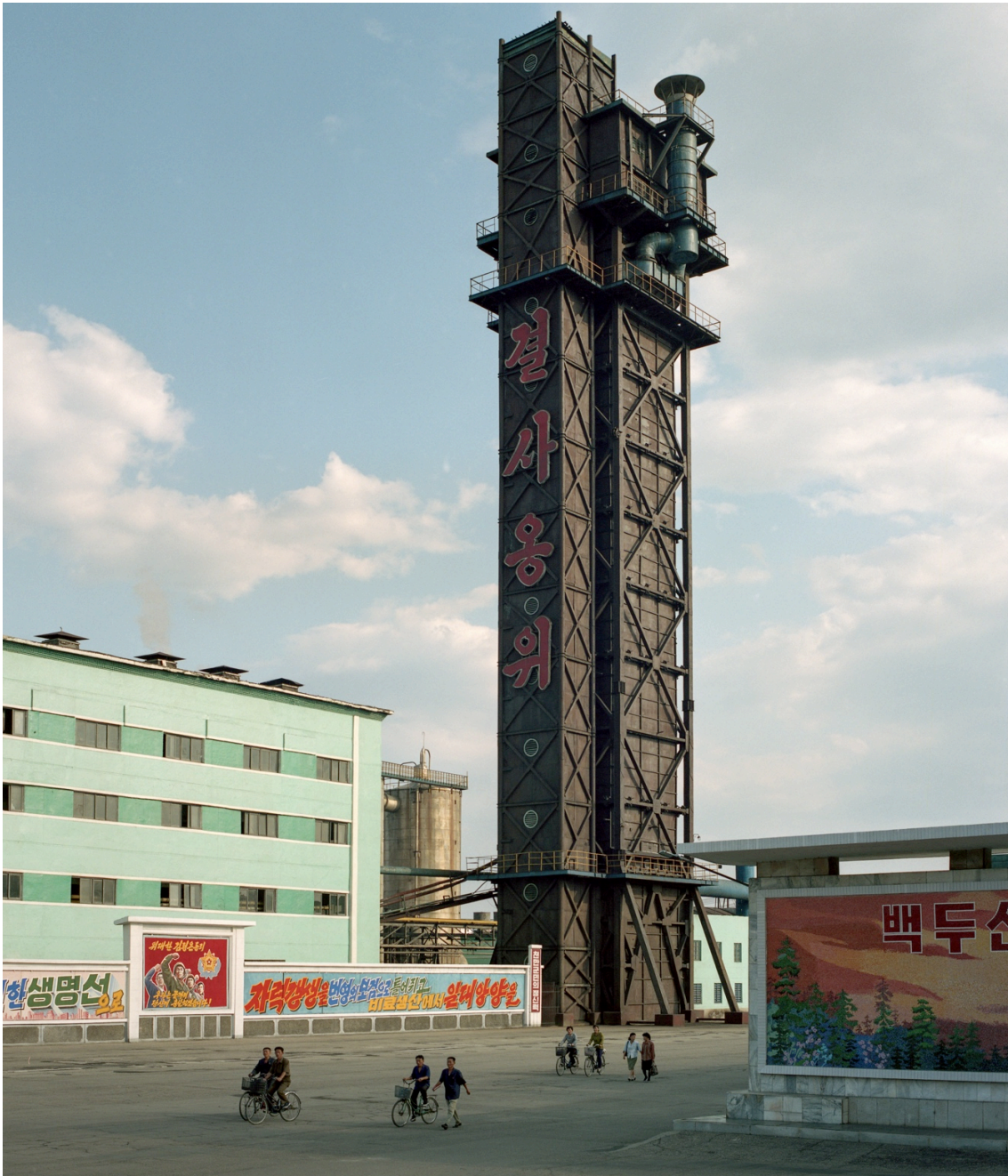
Série Unperson. Hamhung Chemical Factory, 2019