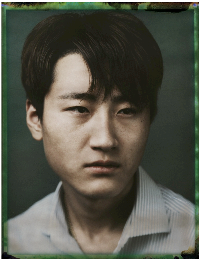
Série Unperson , Noh Cheol-Min, 2019. Tirage pigmentaire sur papier Fine Art

Dans un monde traversé par les questions migratoires, ce projet, né de la volonté de connaître plus intimement le cheminement de ces réfugiés aux histoires contrastées, contribue à faire découvrir la Corée du Nord, pays si énigmatique à nos yeux.