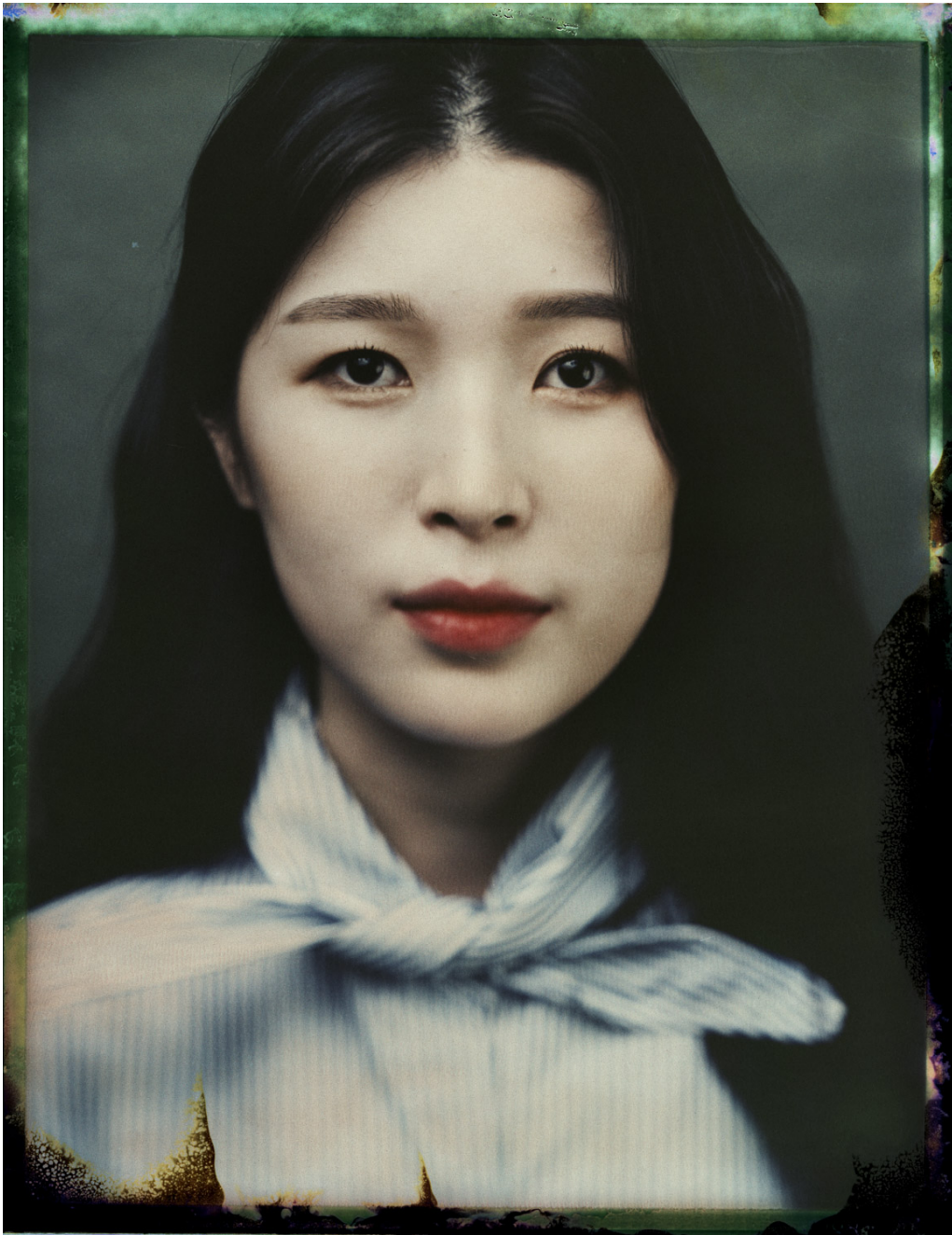
Série Unperson . Kang Nara, 2019 Tirage pigmentaire sur papier Fine Art