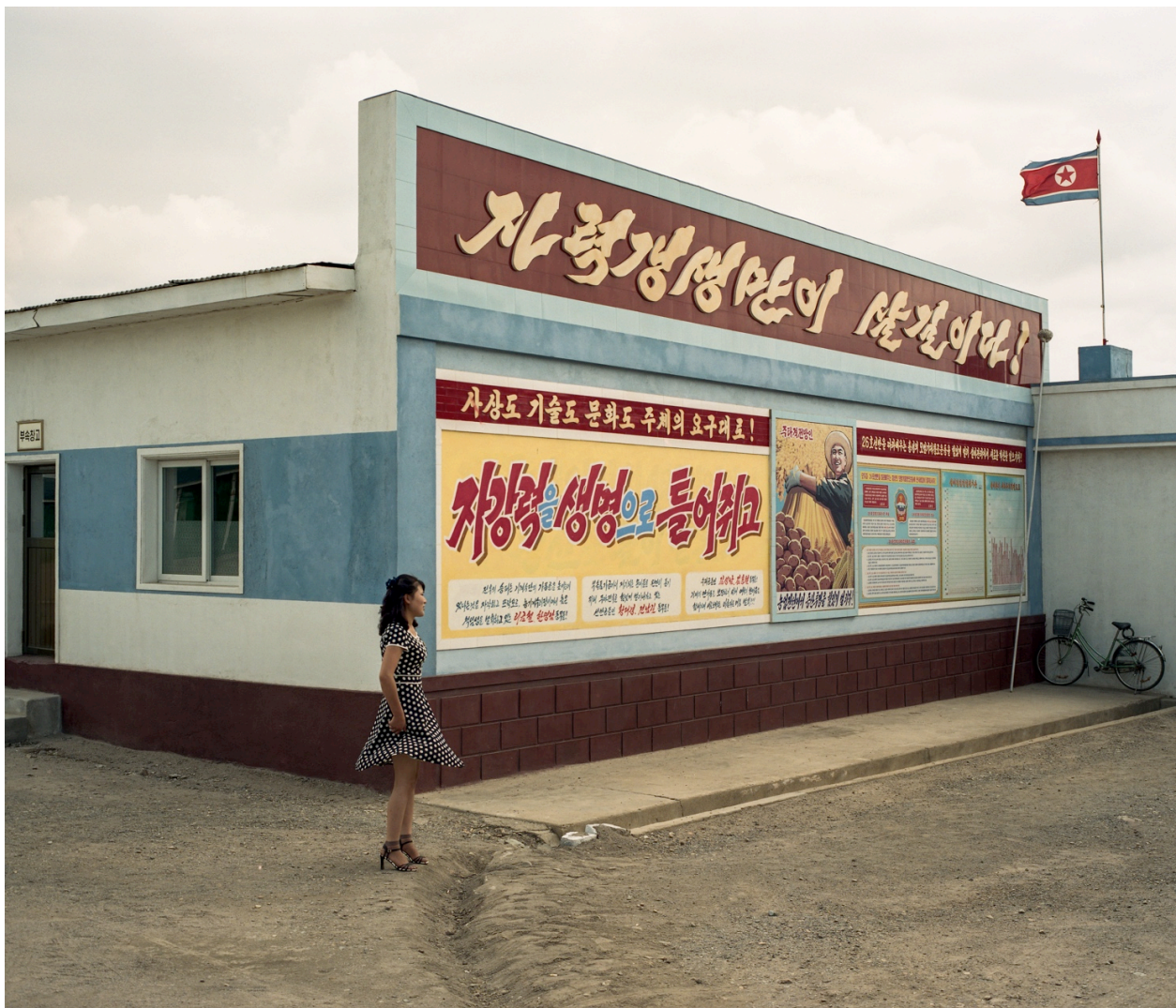
Série Unperson. Sariwon Collective Farm, 2019