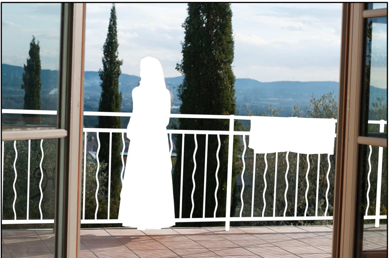
Avant-dire, strate 3, 2017

Vernissage en présence de l'artiste le jeudi 16 novembre 2023 de 18h à 21h