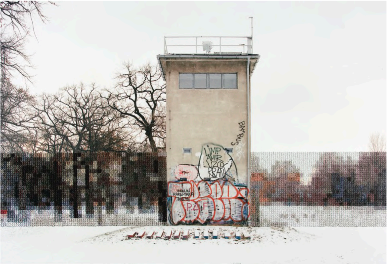
série Berlin, Former Guard Tower Off Puschkinallee, 2013

Tirage pigmentaire brodé à la main | Dimensions : 26,7 x 33,7 cm