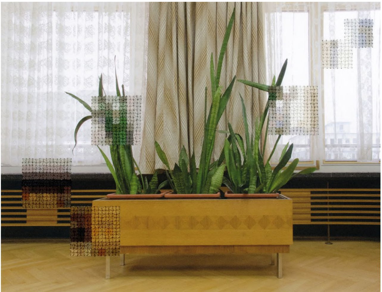
série Berlin, Plants, former offices of the State Secret Police , 2012

Tirage pigmentaire brodé à la main | Dimensions : 15 x 19 cm