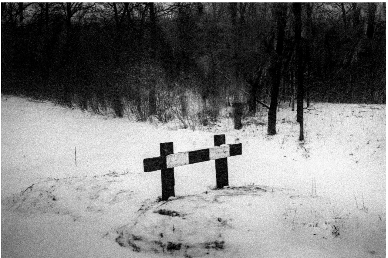
Série Sous terre , Sans titre #27, Lituanie, 2023 Tirage pigmentaire sur papier Fine Art