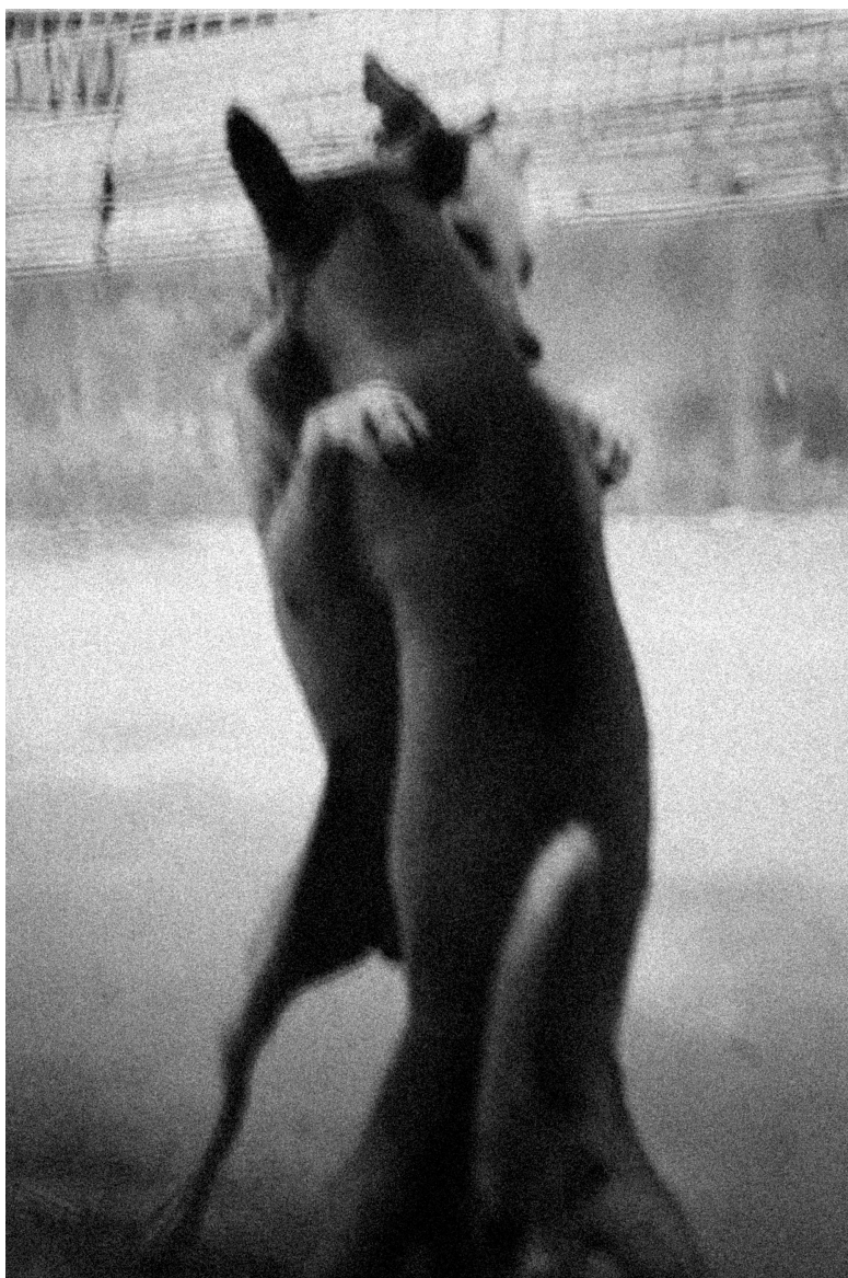
Série Sous terre , Sans titre #08 , Lettonie, 2023 Tirage pigmentaire sur papier Fine Art