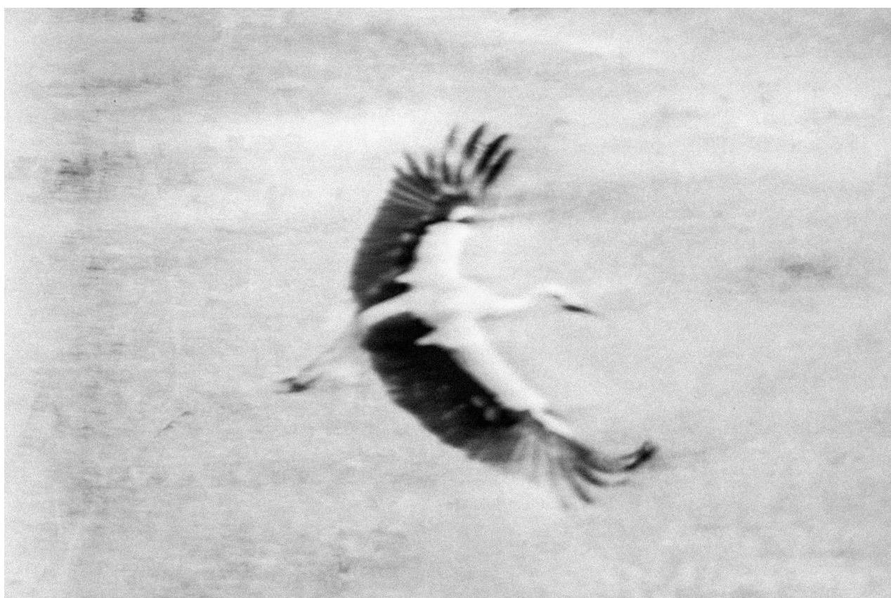
Série Sous terre , Sans titre #03, Pologne, 2023 Tirage pigmentaire sur papier Fine Art