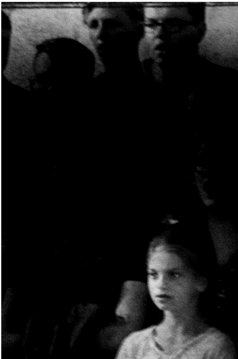
Série Sous terre , Sans titre #02 , Lettonie, 2023 Tirage pigmentaire sur papier Fine Art